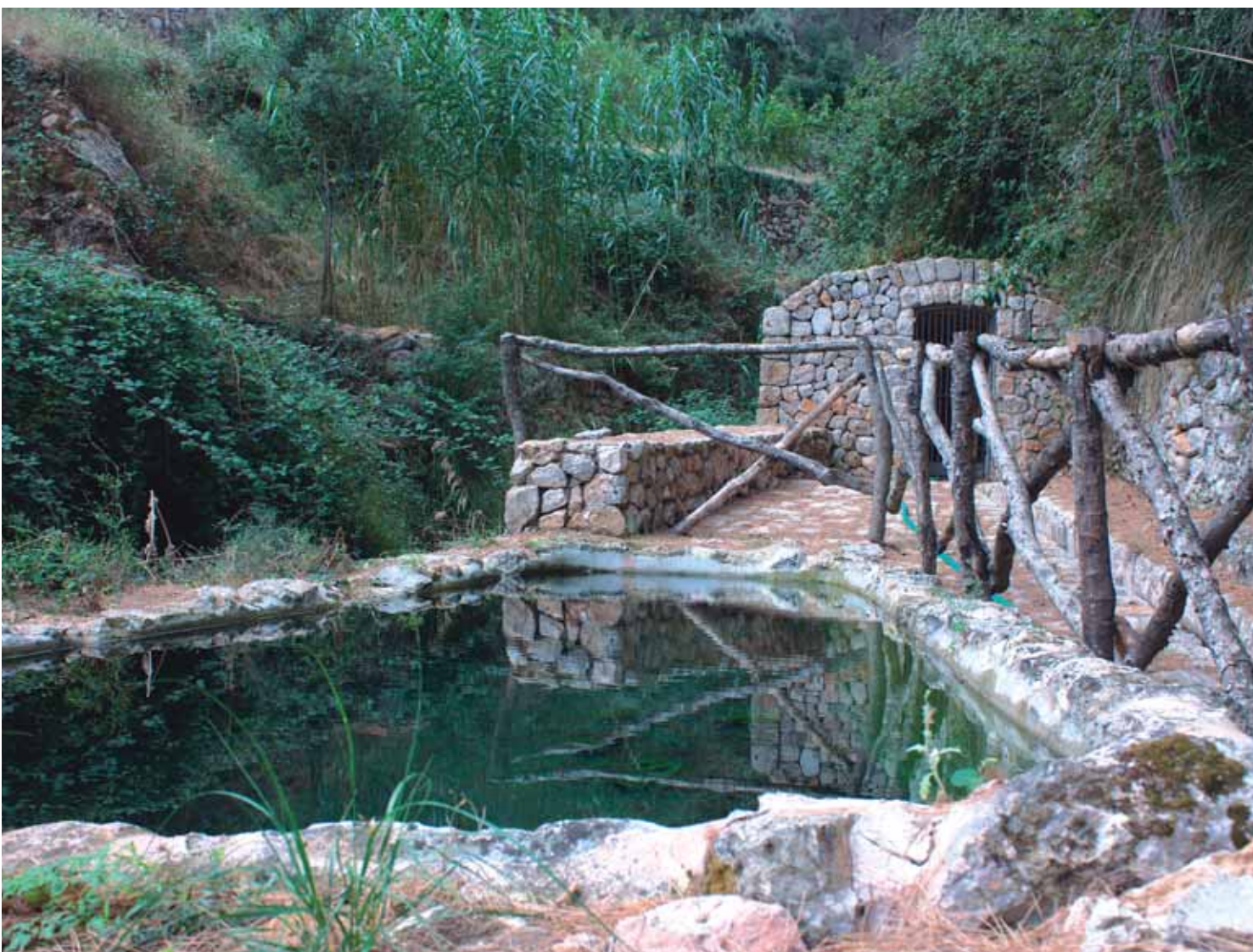
Font de la Vila

de Baix i la de Son Bauzà) que arreplega l'aigua de la font de la Vila i la distribueix fins als grans safareigs; des d'aquests i mitjançant síquies, es reguen les marjades.