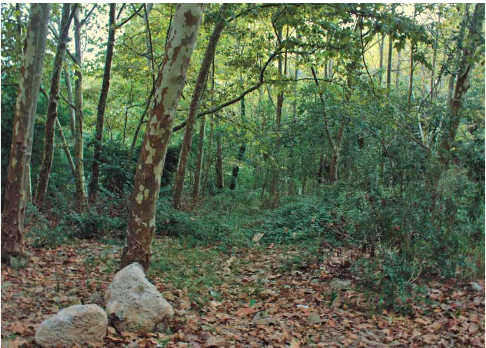
Bosc de ribera al torrent de Sant Pere

En haver travessat la carretera pel pont, ens endinsam en un petit bosc de ribera que creix a banda i banda del torrent. Els boscos de ribera són boscos caducifolis que creixen a prop dels cursos fluvials. Les espècies que hi viuen necessiten molta d'aigua per créixer i per això es desenvolupen a prop de torrents, on el sòl a partir de certa profunditat està amarat d'aigua.