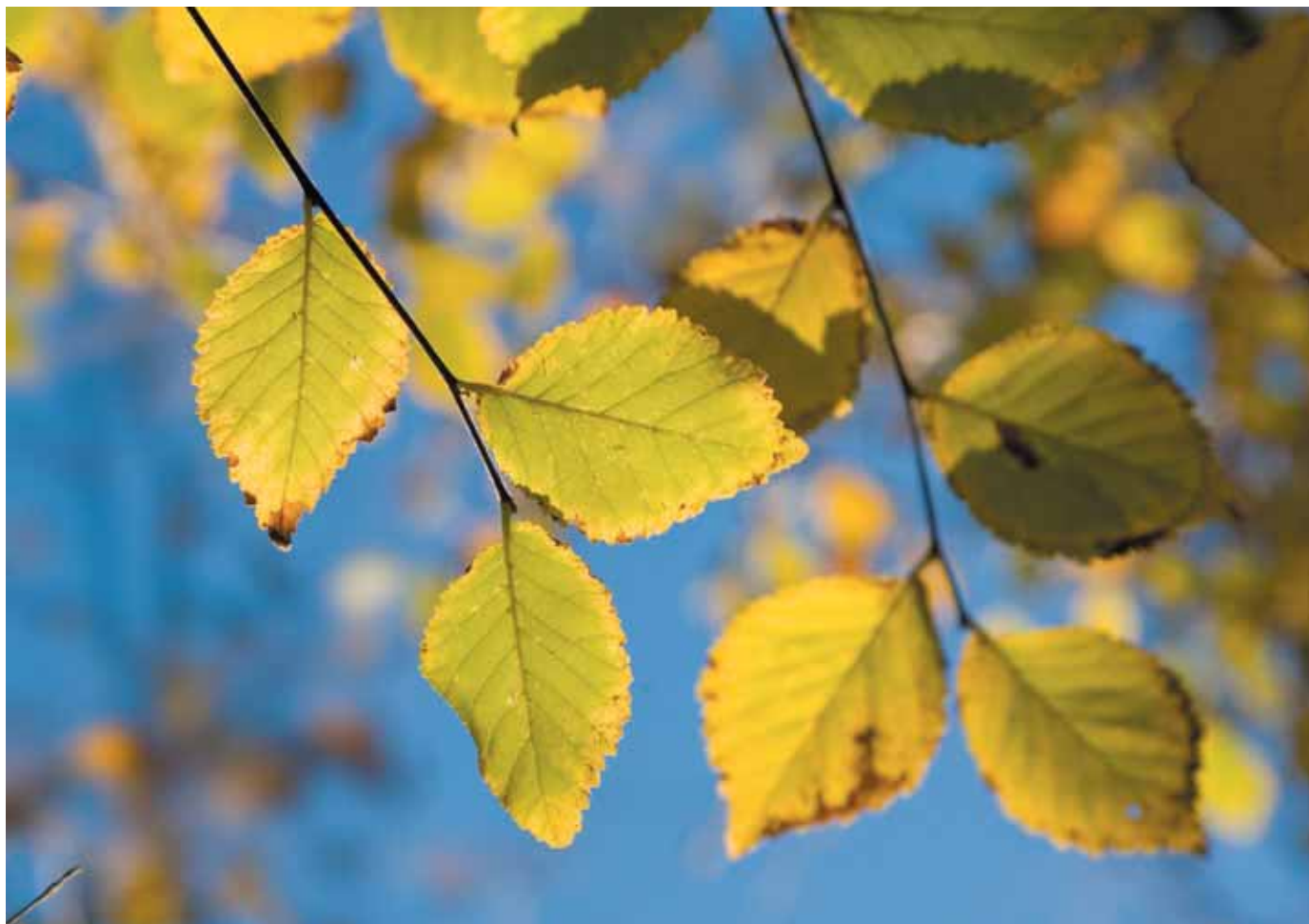
Fulles d'om a contrallum

Els arbres que ens envolten són exemplars alts de polls ( Populus nigra ), oms ( Ulmus minor ) i fleixos ( Fraxinus angustifolia ) i fins i tot plàtans ( Platanus x hispanica ).