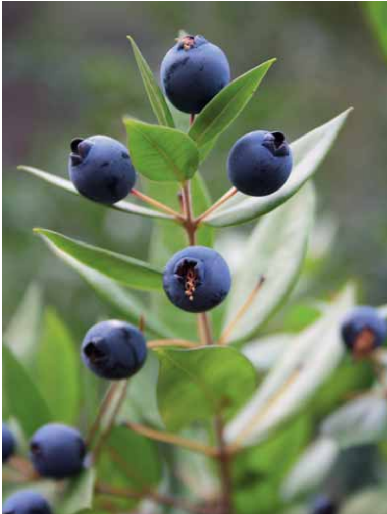
Fruit de Murtra

pensar en les forces geològiques que han hagut d'actuar per moure aquests dipòsits horitzontals cap a la verticalitat, de ben segur que en quedarem admirats.