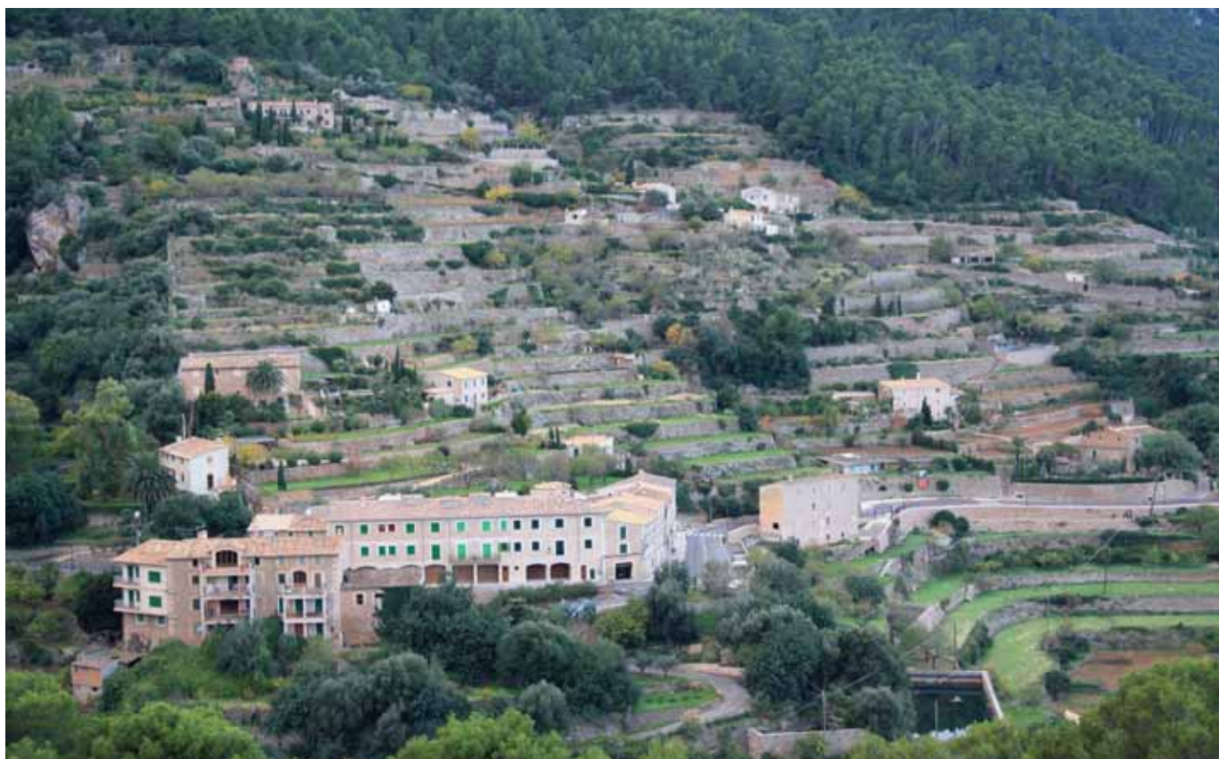
Marjades de Banyalbufar

Iniciem aquesta agradable caminada a vorera de mar a una petita esplanada on podem deixar el cotxe, situada al quilòmetre 85,2 de la carretera Ma-10 d'Andratx a Pollença. Des d'aquest punt tenim una excel·lent panoràmica sobre la vila de Banyalbufar i les seves marjades. Són ben abundants i complexos els sistemes de canalització hídrica, els safareigs i les fonts de mina. Les marjades ben llaurades afavoreixen la infiltració i eviten l'erosió, i sobre elles es produeix hortalissa i vinya talment com temps enrere.