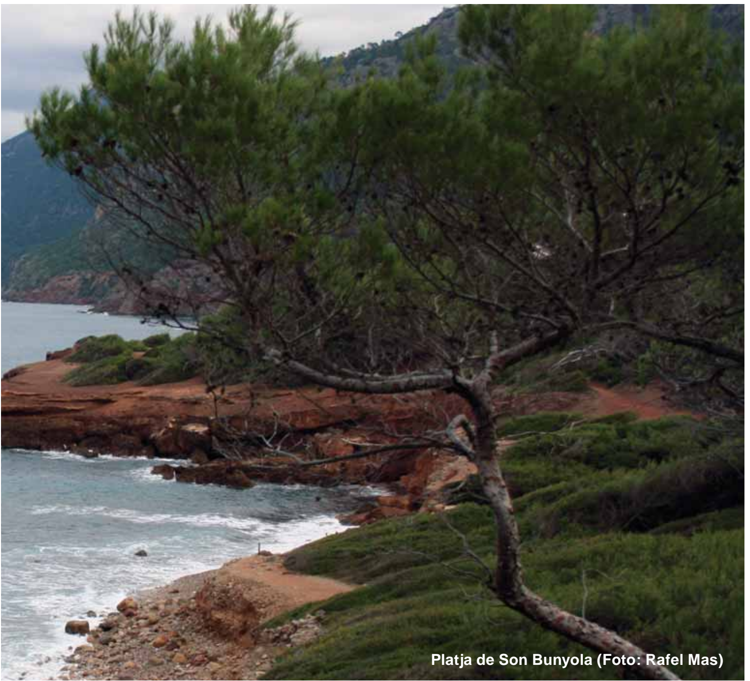
Platja de Son Bunyola

la roca i tot d'una volta a l'esquerra i ens duu a travessar un segon torrent que en determinades èpoques pot dur aigua i s'ha d'anar amb esment per no llenegar. En uns minuts ens trobam a una esplanada sense vegetació i, després de travessar-la, arribam al Port des Canonge. A través d'uns esglaons podem accedir a un mirador sobre la caleta del port. Des d'aquí podem trobar unes quantes alcoves o escars a la dreta i en una altra raconada a l'esquerra, unes rampes fetes amb barres de fusta per on treure les barques. Quan trobam l'asfalt, tenim al nostre davant el nucli urbà, amb les cases més antigues i la urbanització a continuació. Des d'aquest punt, i després de descansar un poc, tornarem sobre les nostres passes cap al punt d'inici.