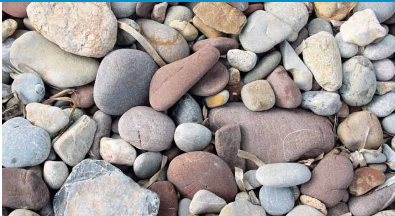
Còdols a la platja

A la platja de Son Bunyola no trobarem arena; es tracta d'una típica cala de còdols de la costa nord de Mallorca. Els còdols són pedres erosionades, fragments de roca modelades per les ones dia rere dia. El fregament entre ells els arrodoneix i mata els caires angulosos fins aconseguir aquestes formes rodones o el·líptiques, llises i suaus. La força de l'onatge dels temporals de nord treu a la superfície còdols de major mida, i depenent de l'estat de la mar, l'aparença de la cala serà diferent, amb pedres de major mida unes vegades i més petites unes altres.