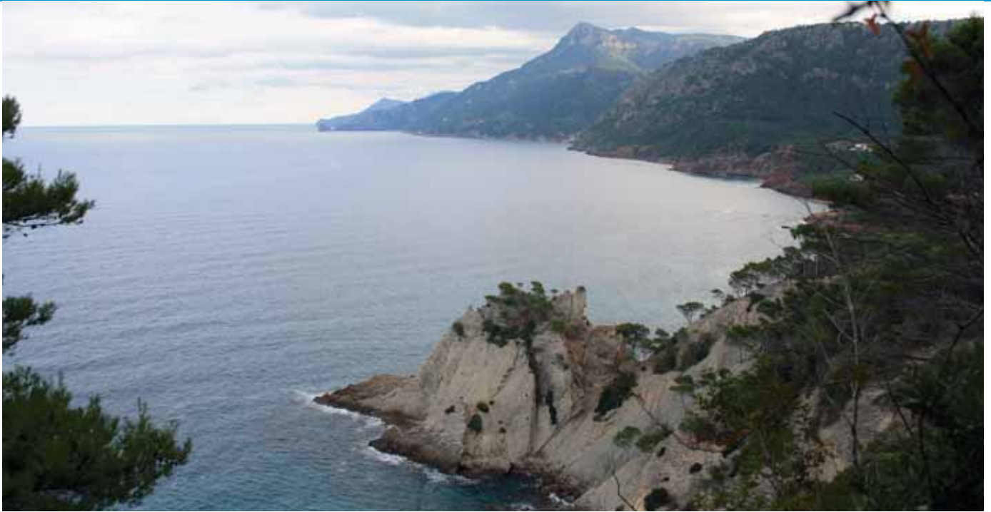
Punta de s'Àguila i al fons na Foradada i el Morro de Sóller

A mà esquerra la presència de la mar es fa evident i a la nostra dreta ens acompanyen unes penyes blanquinoses, que corresponen al puig de ses Planes. Després d'una mitja hora de caminar trobam un rotlo de sitja i una barraca de carboner molt peculiar, que es va construir aprofitant una gran roca o quer. Recentment s'ha reconstruït el capell característic de càrritx. Veurem també les restes d'una antiga casa de pedra. El camí continua sent ample i discorre sobre un marge empedrat i vorejat amb uns importants escopidors de pedra.