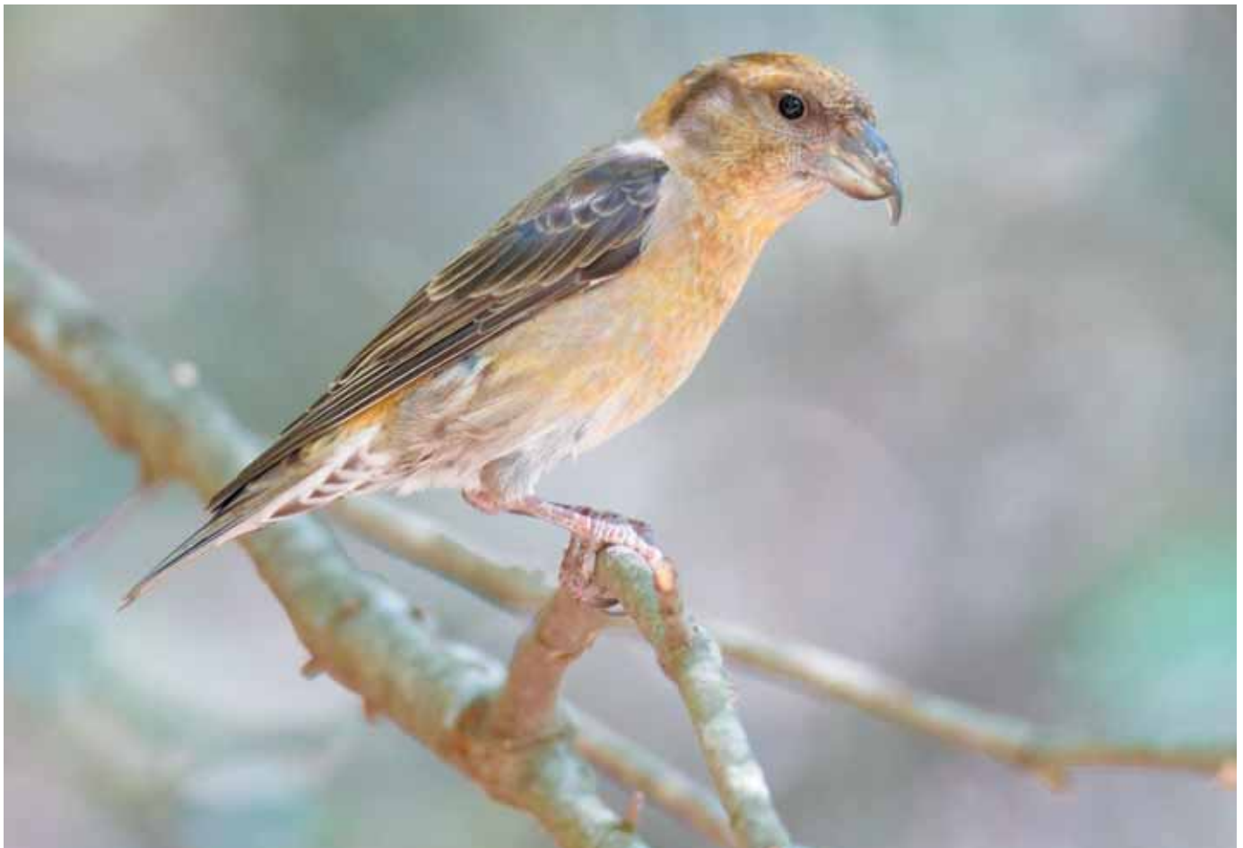
Trencapinyons, Loxia curvirostra

En uns minuts trobam a la dreta del camí que surt un sender poc marcat el qual hem de deixar i hem de seguir per l'esquerra. Si ens hi fixam es poden intuir restes d'antigues marjades, ben evidenciades pels vells garrovers que hi ha intercalats dins del bosc. Els ocells ens acompanyaran al llarg de tot l'any: el busqueret capnegre ( Sylvia melanocephala ), el passaforadí ( Troglodytes troglodytes ), el pinsà ( Fringilla coelebs ), el ferrerico ( Parus major ), el reietó cellablanc ( Regulus ignicapillus )... i durant l'hivern veurem amb abundància el rupit ( Erithacus rubecula ) i el tord ( Turdus philomelos ). Hi ha una espècie que no ens abandonarà en tot el camí i ens aguarà des de qualsevol pi, el trencapinyons ( Loxia curvirostra ). Aquest aucell, d'aspecte i comportaments de lloret, s'alimenta dels pinyons que extreu de les pinyes del pi blanc amb l'ajut del seu potent bec tort i entrecreuat en forma de tenalles. Les femelles són de color verd amb un suau pigallat al ventre, flancs i esquena, mentre que els mascles exhibeixen un roig intens i cridaner. De ben segur que els sentirem cantar mentre es desplacen pels pins i, parant una mica l'orella, sentirem com fan cruixir les pinyes amb els seus becs.