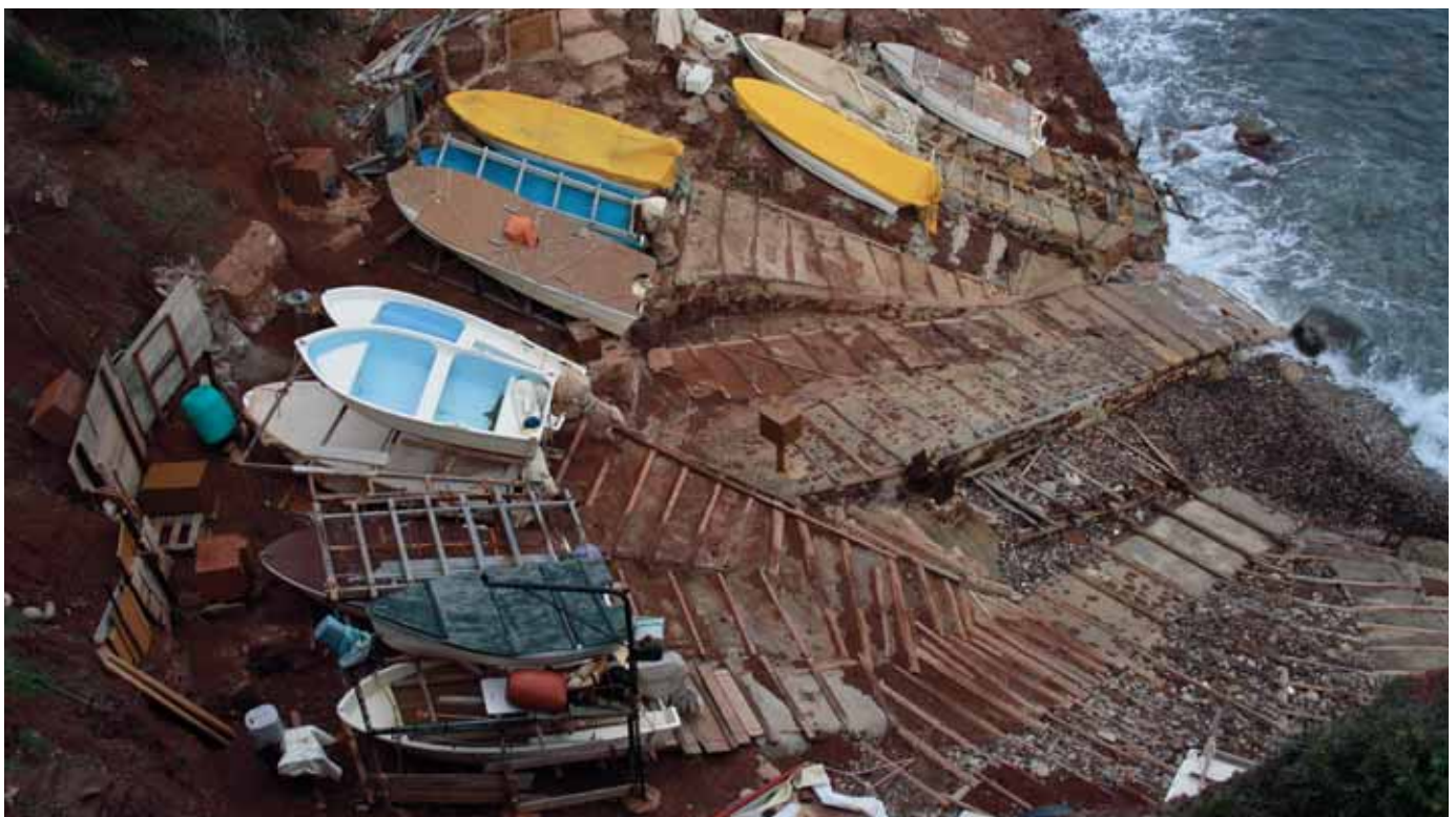
Barques al port des Canonge